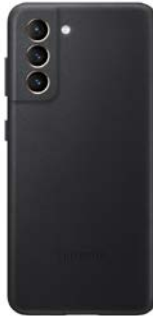
Leather Cover EF-VG991