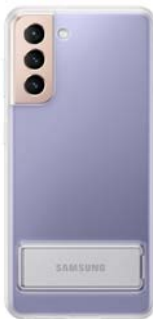
Clear Standing Cover EF-JG991