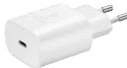
Schnelllade- adapter 25 Watt EP-TA800N