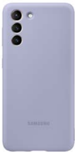
Silicone Cover EF-PG991