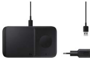
Wireless Charger Duo EP-P4300T