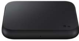
Wireless Charger Pad EP-P1300B