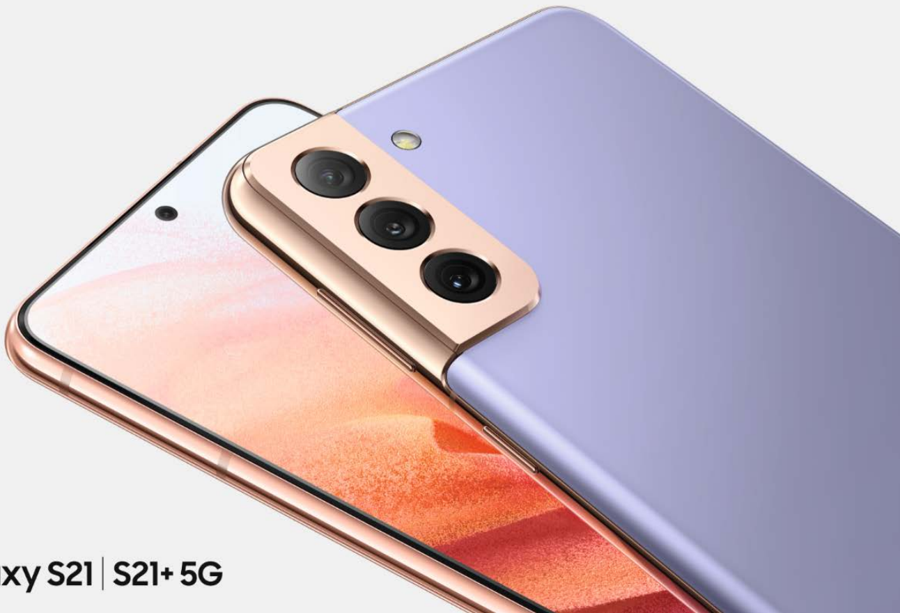
Galaxy S21 | S21+ 5G