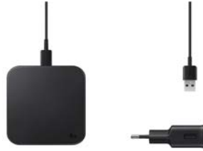
Wireless Charger Pad EP-P1300T