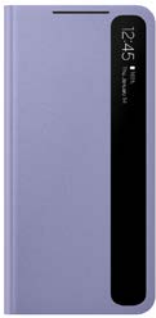
Clear View Cover EF-ZG991