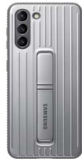
Protective Standing Cover EF-RG991