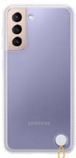
Clear Protective Cover EF-GG991