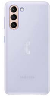
LED Cover EF-KG991