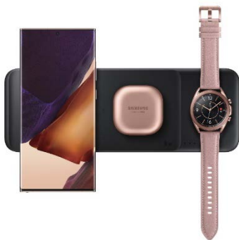
Wireless Charger Trio EP-P6300