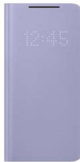
LED View Cover EF-NG991