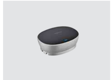
ANSCHLUSSMÖGLICHKEITEN UND VERWENDUNG

Erweitern Sie den Gesprächsbereich von 6 m (20 Fuß) auf 8,5 m (28 Fuß), damit auch die von der Freisprecheinrichtung weiter entfernten Personen deutlich gehört werden. Mikrofone (paarweise verfügbar) werden automatisch erkannt und konfiguriert, indem Sie sie einfach an die Freisprecheinrichtung anschließen.