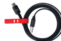
USB-A / USB-C KABEL