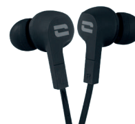
WASSERDICHTE KOPFHÖRER GEMÄSS IPX6