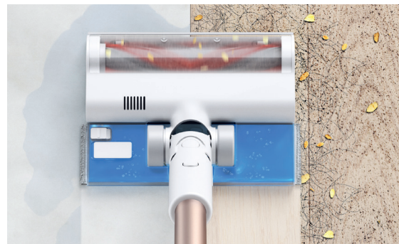
Saugen und wischen in einem Arbeitsgang