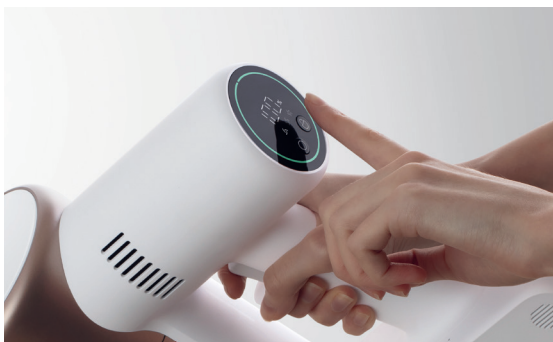
Dauersaugbetrieb wählbar per Knopfdruck