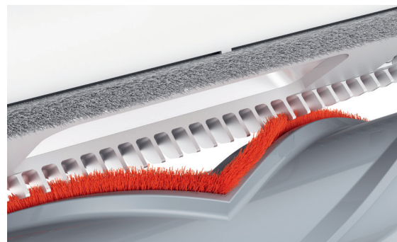
Elektrobürste mit innovativen Design zur Vermeidung von Haaraufwicklung