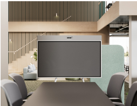
Wagen mit Kamera oben