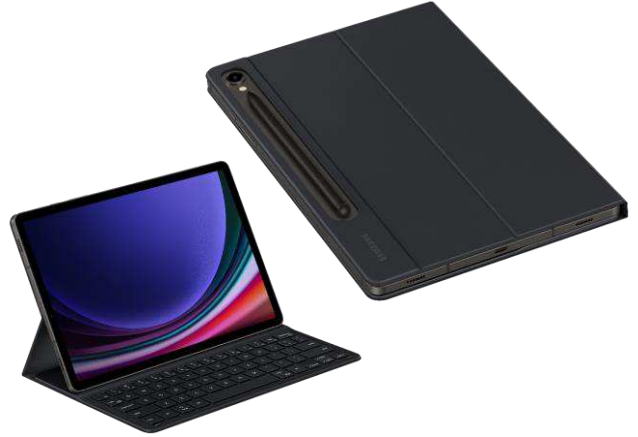
Book Cover Keyboard Slim EF-DX710