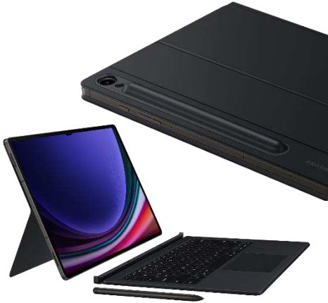
Book Cover Keyboard EF-DX715