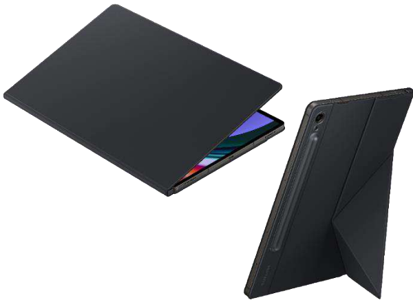
Smart Book Cover EF-BX710