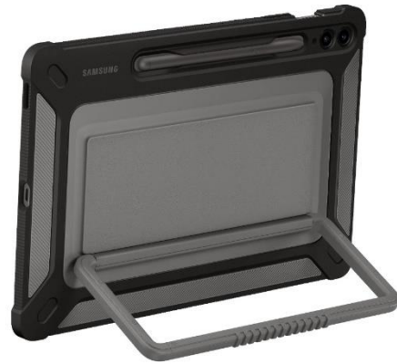
Outdoor Cover EF-RX510