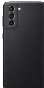
Leather Cover EF-VG996