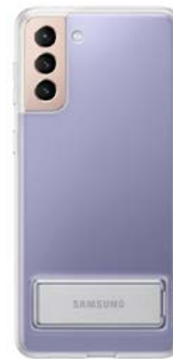
Clear Standing Cover EF-JG996