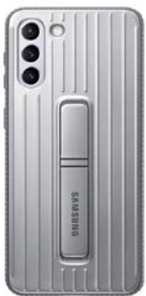
Protective Standing Cover EF-RG996