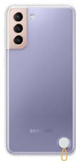
Clear Protective Cover EF-GG996