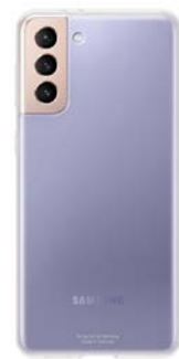
Clear Cover EF-QG996