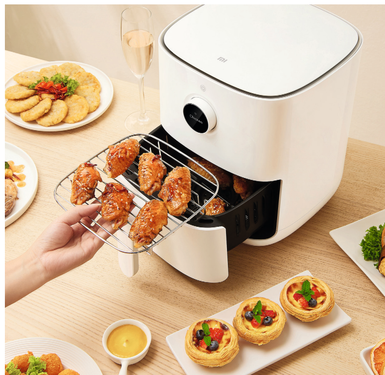
Beispielhafte Produktabbildungen. Tatsächliches Produkt kann abweichen.

Der herausnehmbare und antihafbeschichtete Korb fasst ein Nennvolumen von 3,5 l – und kann nach der Nutzung in der Spülmaschine gereinigt werden.