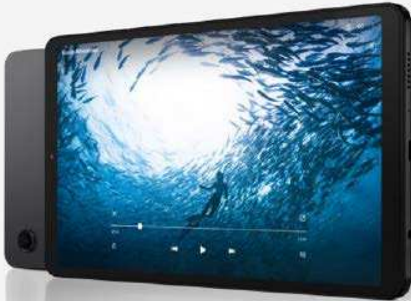
Abbildung entspricht nicht 100% dem tatsächlichen Aussehen des Produkts.