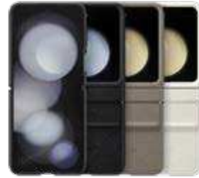
Flap Eco-Leather Case EF-VF731