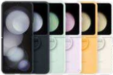
Silicone Case with Ring EF-PF731