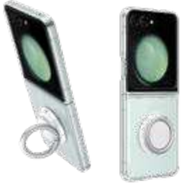
Clear Gadget Case EF-XF731