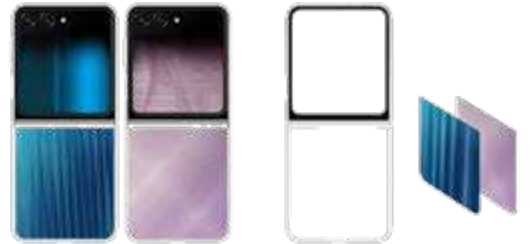
FlipSuit Case EF-ZF731