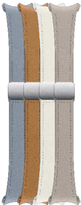
D-Buckle Hybrid Eco-Leather Band (Slim, S/M)