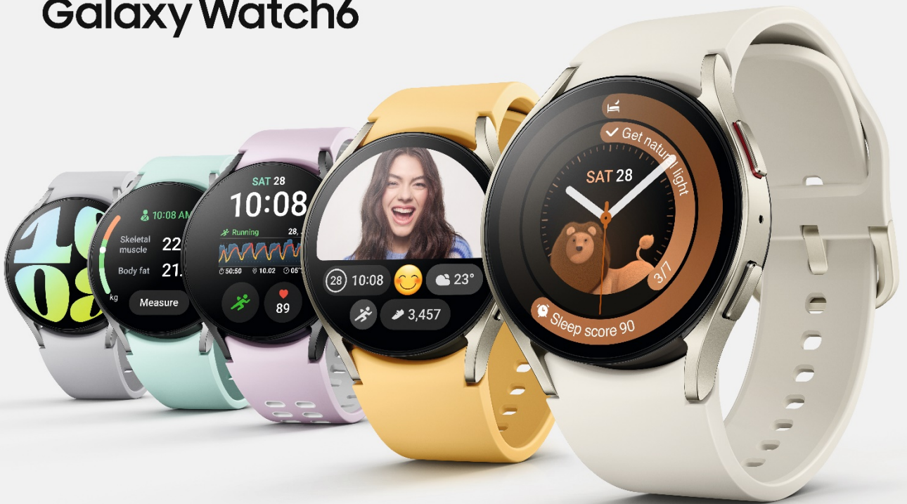
Abbildung simuliert. Farbige Armbänder nicht im Lieferumfang enthalten, sondern separat erhältlich.