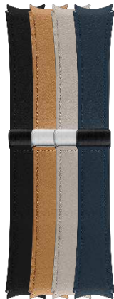
D-Buckle Hybrid Eco-Leather Band (Normal, M/L)