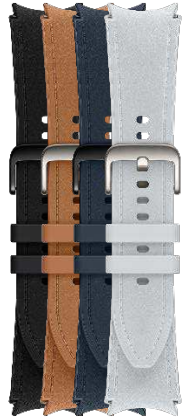
Hybrid Eco-Leather Band S/M | M/L