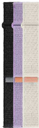
Fabric Band (Slim, S/M)