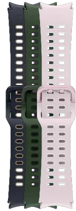
Extreme Sport Band S/M | M/L