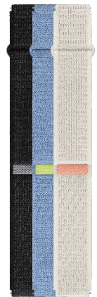
Fabric Band (Wide, M/L)