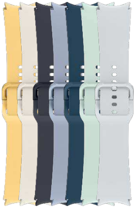
Sport Band S/M | M/L