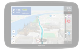
GO Camper Max PP 2. Generation