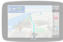
GO Camper Max 2. Generation