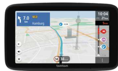
GO Camper Tour 2. Generation

Freuen Sie sich auf maßgeschneiderte Routen und Sonderziele sowie hochwertige TomTom-Karten und das zuverlässige TomTom Traffic. Dank monatlichen Updates für Karten von Europa, drei Routenoptionen und dem dynamischen Fahrspurassistenten sind Sie immer auf der richtigen Spur unterwegs. Der überarbeitete interaktive Touchscreen bietet jetzt eine noch höhere Auflösung, damit Sie keine Abbiegung oder Warnung verpassen. Das TomTom GO Camper Tour kann Sie bei all Ihren Fahrten unterstützen.