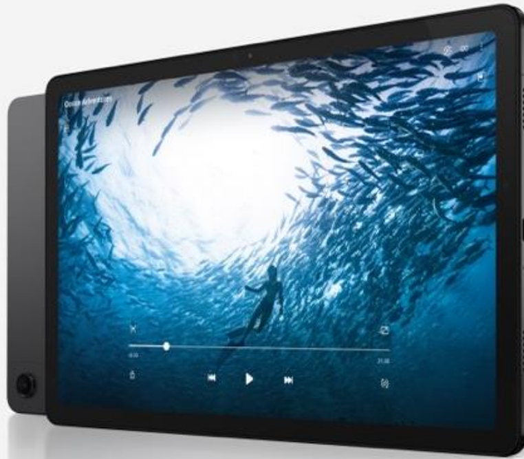
Abbildung senkrecht. Foto- und Mobilfunkfunktionen können je nach Land oder Anbieter variieren.