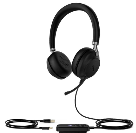
UH38 Dual Teams-BAT UH38 Dual UC-BAT

Das UH38 verfügt über ein hochwertiges und stabiles Design aus hochwertigem Kunststoff mit einer Metallverstärkung. Das hautfreundliche Material, weicher, ergonomisch geformter Memory-Schaumstoff, ist auch nach einem langen Arbeitstag sehr bequem.