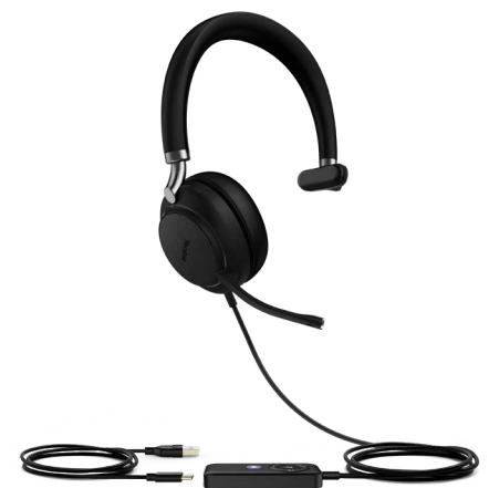
UH38 Mono Teams-W/O BAT UH38 Mono UC-W/O BAT